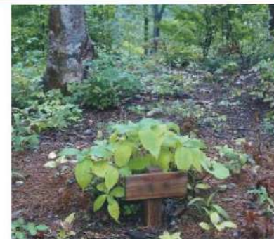
かつての樹木葬は山の中などにしかなかった。

かつての樹木葬は、山間部にしかありませんでした。墓石の代わりに樹木を植えることで、樹木一本一本を墓標とするものでした。ただ、樹木は年々成長し埋葬の場所がわかりにくくなり、お参りなどをする人から「どこに拜んだらいいかわからない」、「アクセスが悪い」などの問題があり、樹木葬を選ぶ人は多くありませんでした。