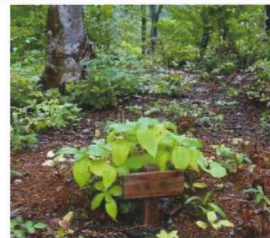
かつての樹木葬は山の中などにしかなかった。

かつての樹木葬は、山間部にしかありませんでした。墓石の代わりに樹木を植えることで、樹木一本一本を墓標とするものでした。ただ、樹木は年々成長し埋葬の場所がわかりにくくなり、お参りなどをする人から「どこに拜んだらいいかわからない」、「アクセスが悪い」などの問題があり、樹木葬を選ぶ人は多くありませんでした。