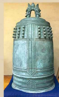
静岡県指定文化財の梵鐘 (嘉吉3年=1443年)

他に今川氏真の文書、延命地藏菩薩像など多くの文化財があります。境内には生前よく訪れた日本画家竹内栖鳳の筆と爪を納めた塚があり、吉川英治の追悼文を刻んだ碑もたっています。