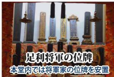
足利将軍の位牌 本堂内では将軍家の位牌を安置