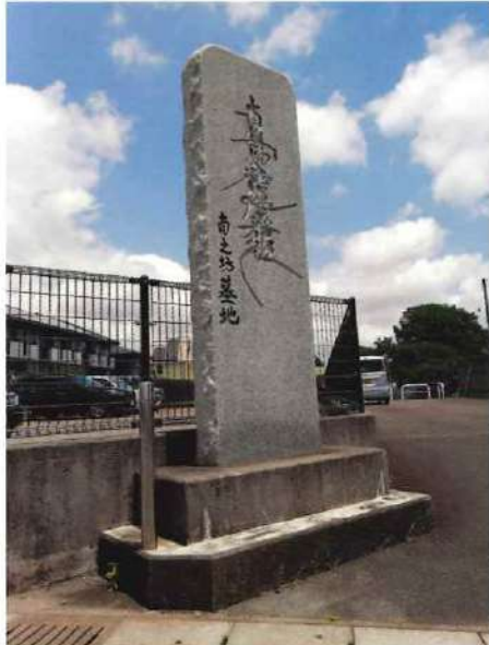
南之坊墓地西側入口