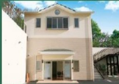
お気軽にご利用いただける管理棟