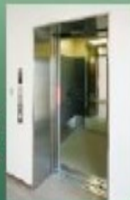
エレベーター完備

管理棟には常駐の管理人がおり ますので、いつでもお参りに来られて も安心です。また、法要・食費等 のご相談にも応じております。