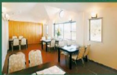
お参りの際にもゆったりとくつろげる休憩所