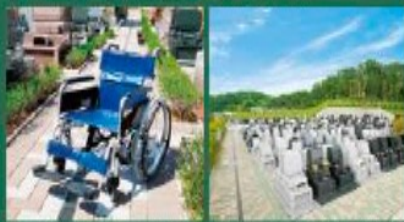
車いすをご利用しております 広い参道でお参りもラクラク!

お年寄りの方やお身体の不自由な方も安心してお参り いただける全区域バリアフリー設計となっております。 墓域の参道も広いので大変安心です。