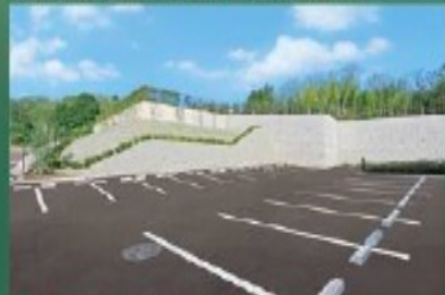
運転が苦手な方にも安心の広い駐車場

お車で安心してご参園いただけるよう、駐車スペース 全て平置き式の駐車場となっております。