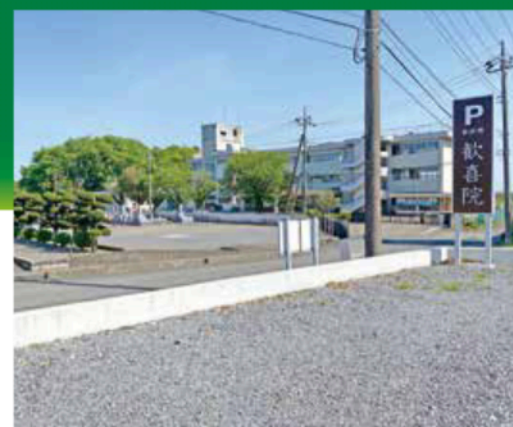
●大型駐車場がございます。