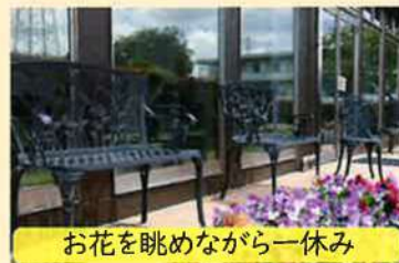
お花を眺めながら一休み