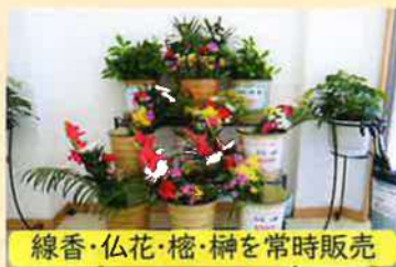
線香・仏花・桜・榊を常時販売