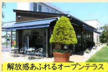
解放感あふれるオープンテラス