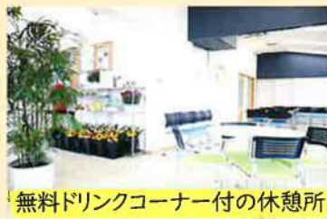
無料ドリンクコーナー付の休憩所