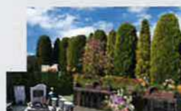
⑩桃源郷・思い出の碑