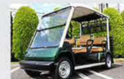
⑮足が不自由な方でも安心の見学用カート