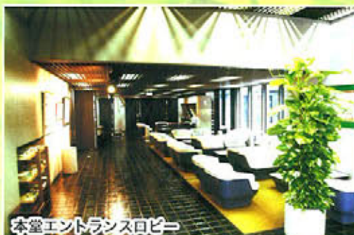
本堂エントランスロビー