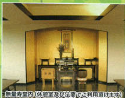
無量寿堂内(休憩室及び法要でご利用頂けます)