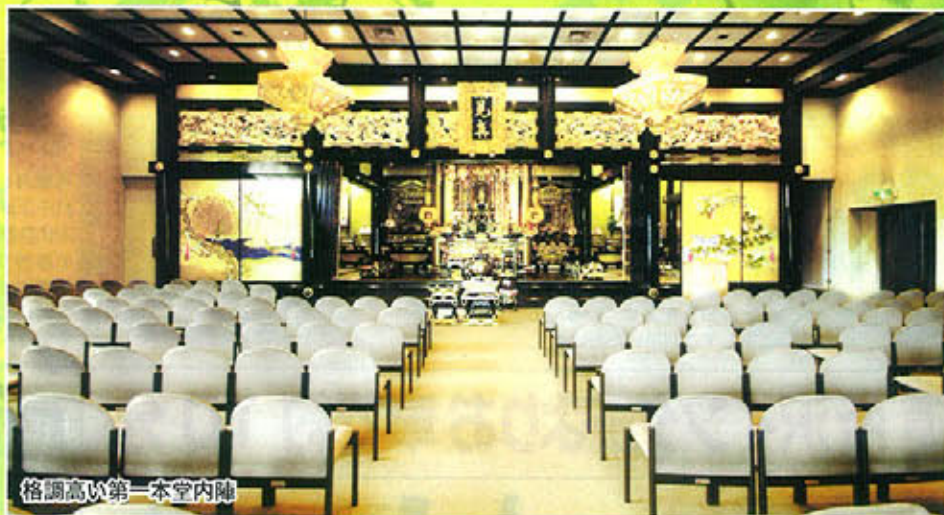
格調高い第一本堂内陣

格調高い本堂をはじめ、礼拝堂も併設する預骨室などの充実の設備は、伝統ある寺院ならではの。ご法要からご会食まで、安心してご供養いただける設備が整っております。