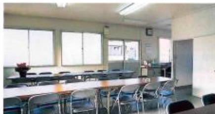
▲管理事務所(こちらでご休憩ができます。)