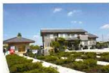
休憩所や法要施設を完備する管理棟