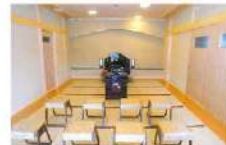
管理棟内の法要室

ご予算に合わせて、お求めやすい区画からゆとりのある大きな区画まで、自由にお選びいただけます。