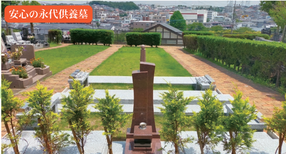
安心の永代供養墓

公共交通機関・車ともにアクセスが良く、自然豊かな景観と好条件でありながら、手頃な価格が魅力です。 永代供養墓「スズラン」も誕生し、お墓の後継者にお悩みの方も安心してご利用いただけます。 ご利用いただく場合には、檀家になる必要はありません。