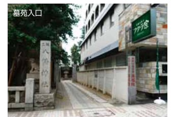
(※駐車場は中にあります。)