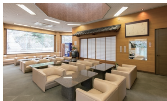
管理事務所内では、 ゆったりとご休憩いただけます。