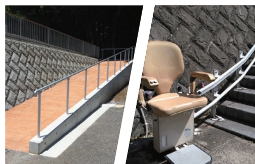
スロープや昇降機も設置しており お参りの方にも優しい霊園です。