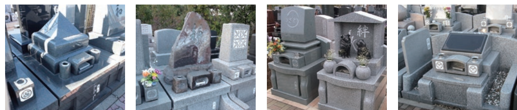
施工例① 施工例② 施工例③ 施工例④

お好きな石・デザインを選んでいただけます。 ※墓石・デザイン代は別途となります。