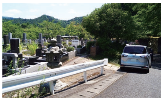
園内は自動車を通れる参道を設けておりますので 区画の近くまで車で行くことができます。